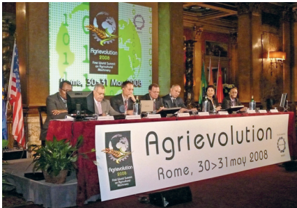
La prima edizione di Agrievolution si è svolta a Roma il 30 e 31 maggio del 2008

La seconda edizione di Agrievolution si è tenuta ad Orlando (Florida) nei giorni 11 e 12 gennaio scorsi. L'evento era inserito all'interno di Ag Connect, la nuova fiera dedicata alla meccanizzazione agricola promossa da Aem, l'associazione dei costruttori americani e che si è tenuta dal 13 al 15 gennaio scorsi.